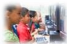
Digitale leeromgeving & school onafhankelijk