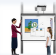
Digitale lessen meteen online beschikbaar