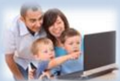
Digitale leeromgeving buiten school