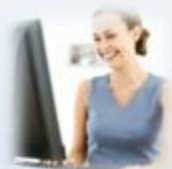
Flexibele werkplekken docenten