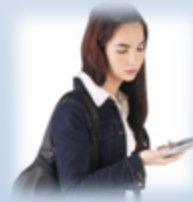
Sms-diensten & VOIP