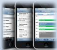
Mobiele agenda's en mail voor docenten