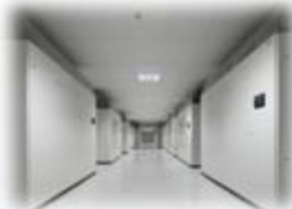
Gecentraliseerde ICT voor de gehele stichting School A School B Etc..